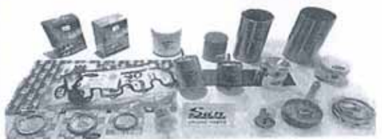
SU SPENSION PARTS