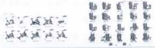
New York Series