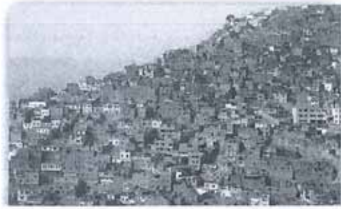
利馬市貧民窟，居民毫無衛生條件抗疫

秘魯雖然經歷極嚴格的居家隔離措施，但事實證明該措施對於貧窮人口過多的國家是無效的。秘魯人口為3,200萬，據統計7成為非正規勞工，他們無法取得政府補助，多數只得靠街頭打臨工(如販售口香糖或擦車窗)維持家計，不外出賺錢就會餓死，因此要求他們遵守居家隔離的規定是相當困難的。