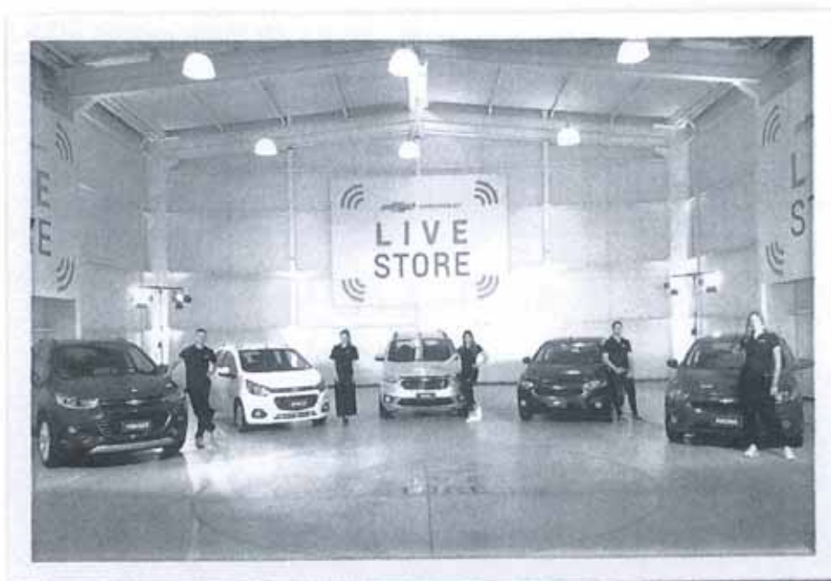
Chevrolet 汽車公司在秘魯舉辦之 Live Store 活動