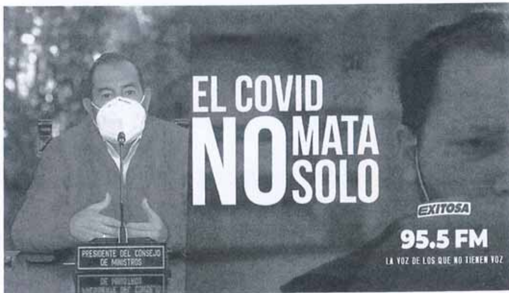
內閣總理 Walter Martos 親上火線說明抗疫進展

(五)秘魯政府復甦政策：為刺激景氣，秘魯新任內閣總理 Walter Martos 宣布多項新經濟計畫，例如預計於 2020 年及 2021 年分別投入 57 億美元及 35 億美元預算改善公共投資、投入 286 億美元執行「國家競爭力基礎建設計畫」(PNIC)及投入 4 億美元執行 6 項民間參與公共建設計畫，該等政府大型公共建設計畫可望帶動金屬機械產品之需求。