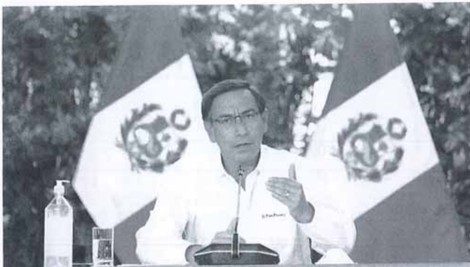
秘魯總統 Martín Vizcarra 進行疫情狀況解說

秘魯從3月16日開始進入全國緊急狀態，並實施極嚴格的居家隔離措施，民眾只得外出去超市、醫院及銀行。鎖國長達100多天連帶的後果是經濟大幅衰退，秘魯經濟暨財政部指出，今年上半年經濟已衰退17.4%，預計下半年透過復甦計畫衰退幅度將可縮小至7%，因此本年全年經濟將衰退12%，專家並稱秘魯2020年衰退幅度在拉丁美洲僅次於委內瑞拉。