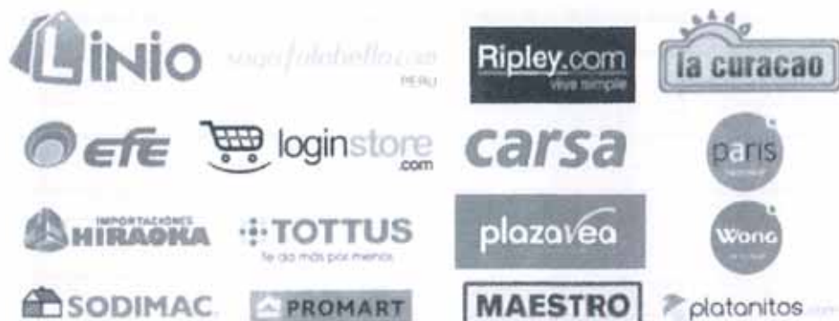
秘魯主要電商交易平台