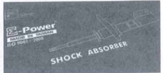
HONDA CRV 2006-2011