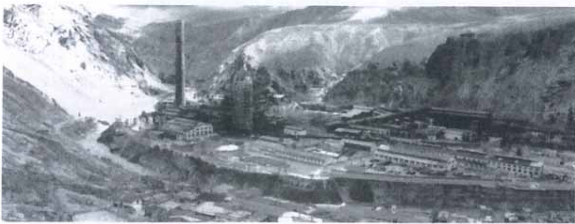
秘魯 La Oyola 鋼鐵工業區